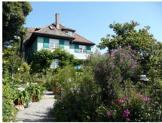
Hermann Hesse Haus, Gaienhofen