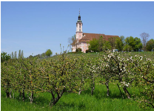
Wallfahrtskirche Basilika, Birnau